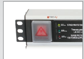
Coperchio per Interruttore