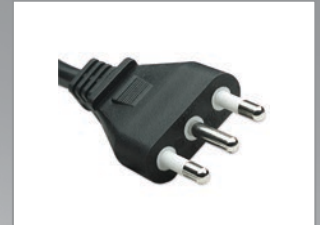
Spina italiana 2P+T 16A

Multipresa, barra di alimentazione installabile a rack; permette di collegare ed alimentare i dispositivi installati all'interno degli armadi 19" destinati a uffici, aziende, sale server, etc.