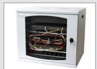
Esempio di Applicazione

Cod.: I-CASE STRIP-13P Multipresa 6 vie con cavo da 3 m